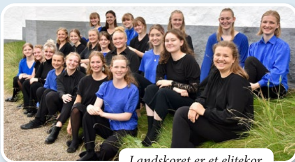
Landskoret er et elitekor for sangere på 14-24 år

Søndag den 15. september kl. 14.00 i Asmild Kirke