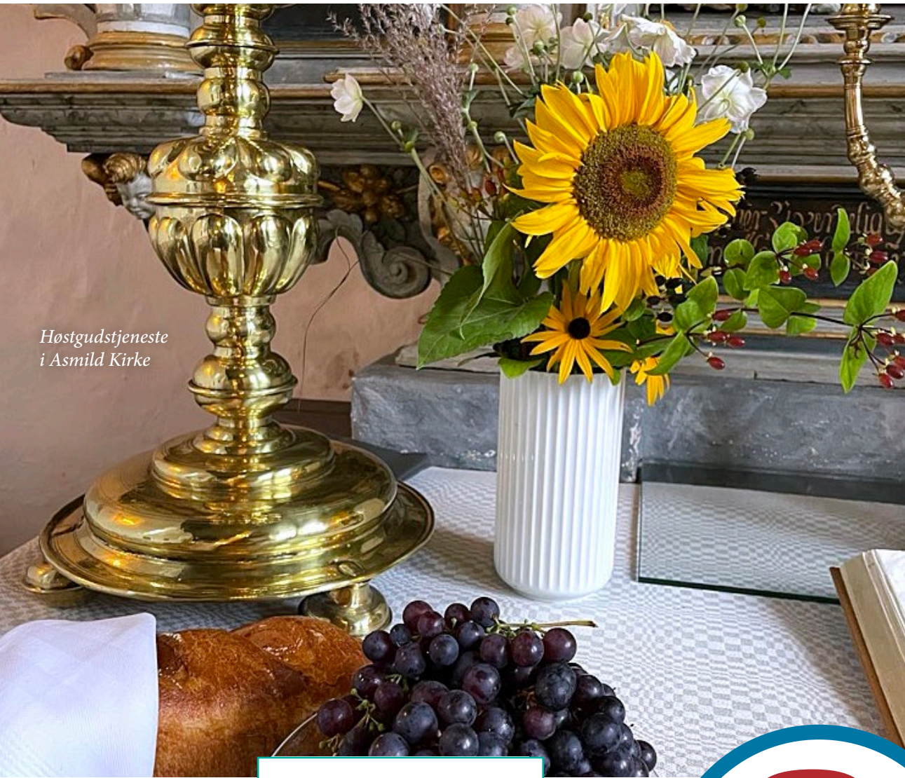
Høstgudstjeneste i Asmild Kirke

78. årgang · September · Oktober · November 2024